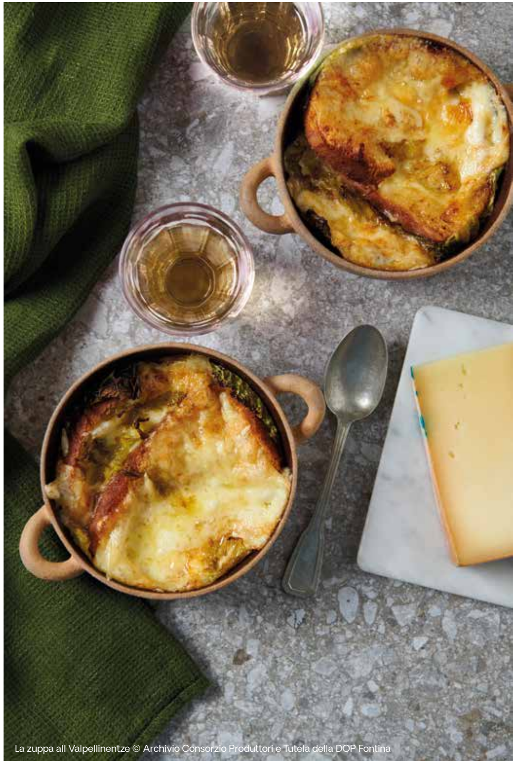
La zuppa all Valpellinente

Il Consorzio Produttori e Tutela della DOP Fontina, costituito ad Aosta nel 1952, riunisce oggi oltre 160 soci tra produttori, stagionatori e confezionatori. Ha il compito di garantire l'autenticità del prodotto attraverso marcature e controlli, oltre a tutelare, promuovere e valorizzare la Fontina DOP in Italia e all'estero. Il Consorzio svolge inoltre un ruolo centrale