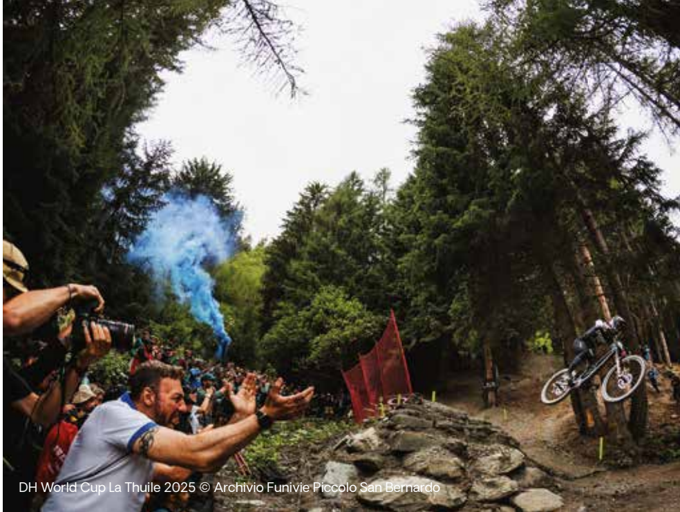
DH World Cup La Thuile 2025

Per maggiori informazioni e per acquistare i biglietti: www.lathuileworldcupmtb.com infoWC@lathuile.net Tel. +39 0165 884142