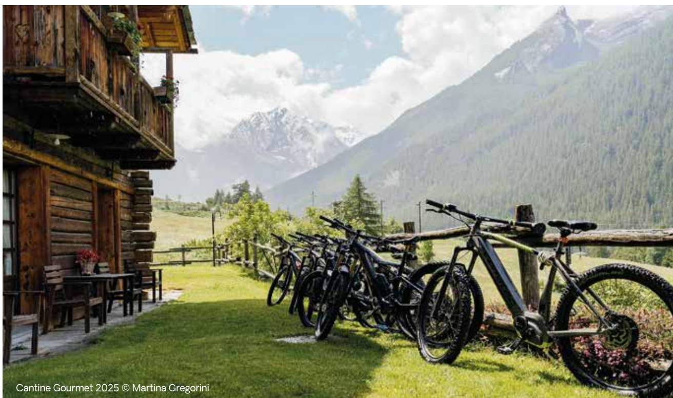
Cantine Gourmet 2025

Dal 5 al 7 giugno arriva il week end dedicato ai buongustai