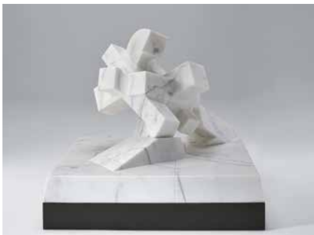
Gio' Pomodoro, Bozzetto per la scultura Sole caduto Aosta, 1998-2002, marmo bianco di Trani, 54 x 91 x 48 cm. Castello Gamba, inv. 460 AC

Il legame con la Valle d'Aosta si manifesta in maniera esemplare in Sole serpente , opera in acciaio patinato, fusa nelle storiche acciaierie DeltaCogne di Verres e presentata nel 1988 alla Biennale di Venezia. L'opera, oggi parte della collezione permanente del Castello Gamba, è esposta in occasione della mostra accanto