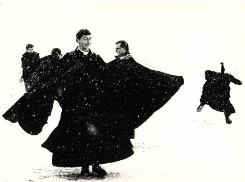
1. Mario Giacomelli, Caroline Branson da Spoon River, 1967-1973 Stampe vintage alla gelatina ai sali d'argento