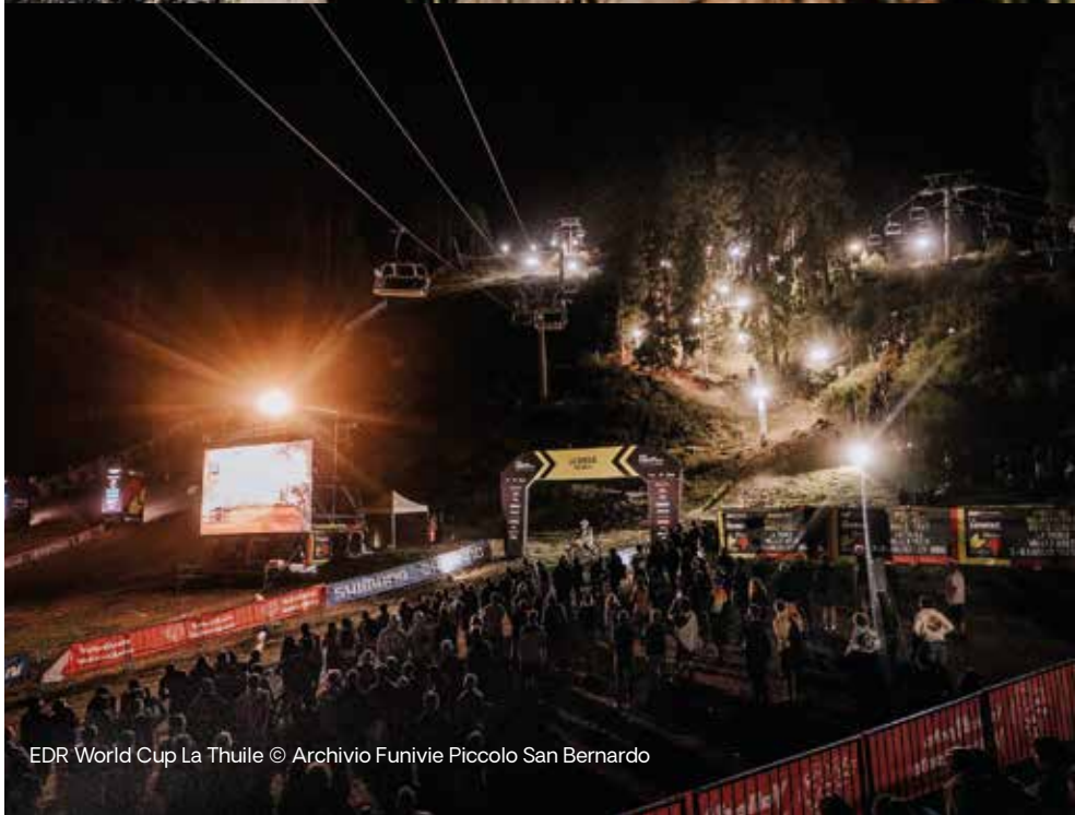
EDR World Cup La Thuile