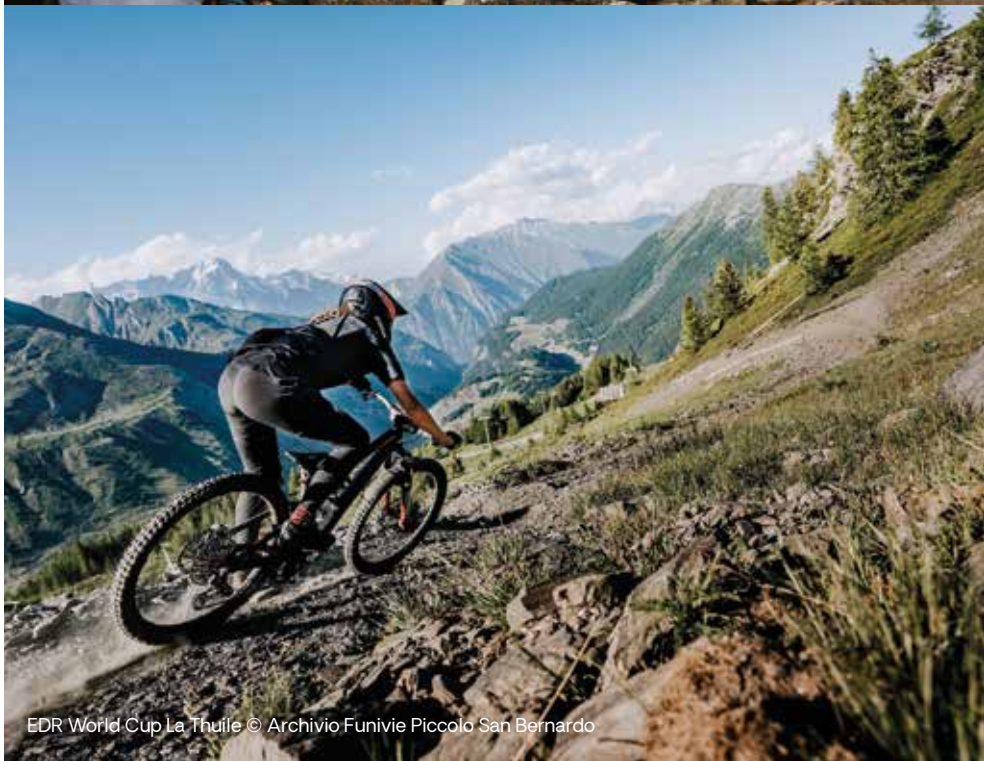
EDR World Cup La Thuile