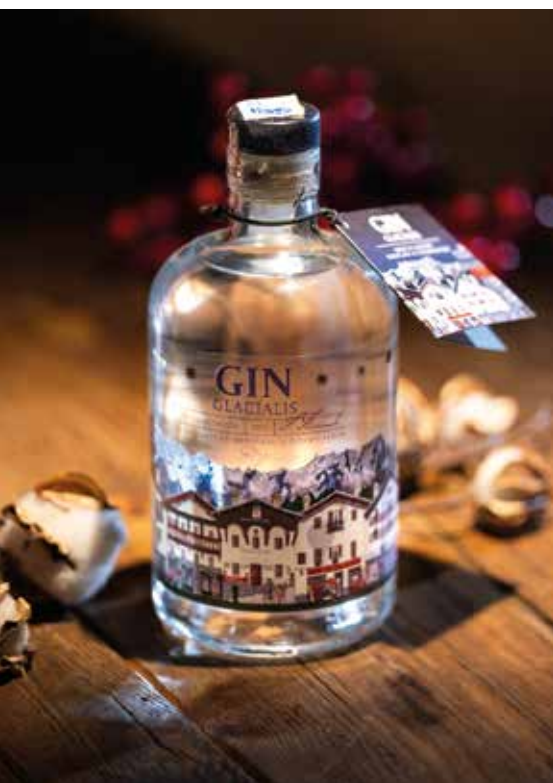
Gin Glacialis, edizione Courmayeur

Gin Glacialis edizione Courmayeur - Levi