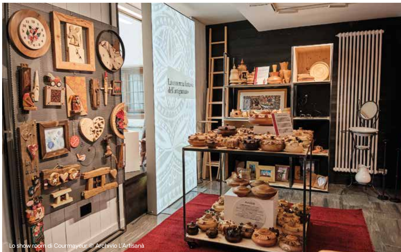
Lo show room di Courmayeur

A marzo L'Artisanà ha inaugurato la sua nuova sede a Courmayeur, in via Roma 75, nel cuore del centro pedonale. Il negozio, che prima si trovava lungo le scale che scendono dalla piazza della chiesa, si è trasferito per offrire maggiore visibilità e una posizione più centrale, in linea con la strategia di valorizzazione e promozione dell'artigianato valdostano.