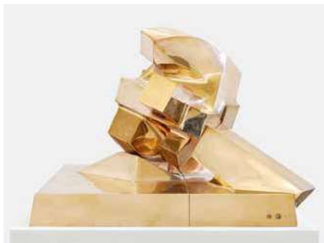
Gio' Pomodoro, Sole Aosta , 2000, bronzo lucido, 61,5 x 80,3 x 87 cm. Collezione privata