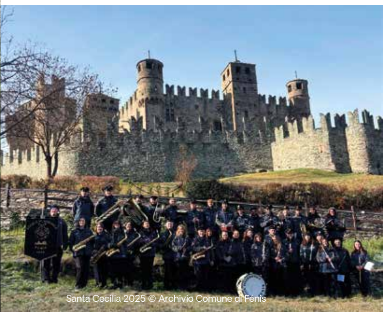
Santa Cecilia 2025