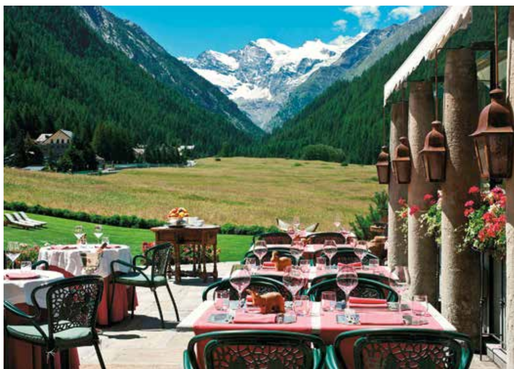
La terrazza dell'hotel Bellevue & Spa di Cogne